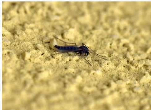
Testata con successo in Brasile una nuova generazione di insetti caricata con un gene killer