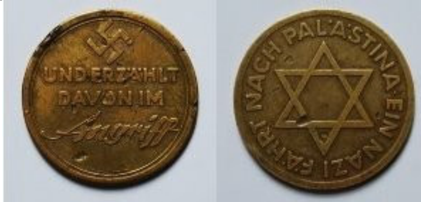
Medaglia commemorativa della collaborazione tra autorità tedesche e associazioni ebraiche sioniste durante gli anni trenta

Una immagine singolare che sintetizza meglio di altre la collaborazione tra nazisti tedeschi ed ebrei sionisti è la medaglia commemorativa coniata allo scopo dal Governo tedesco che reca su una faccia la svastica e sull'altra la stella di David.