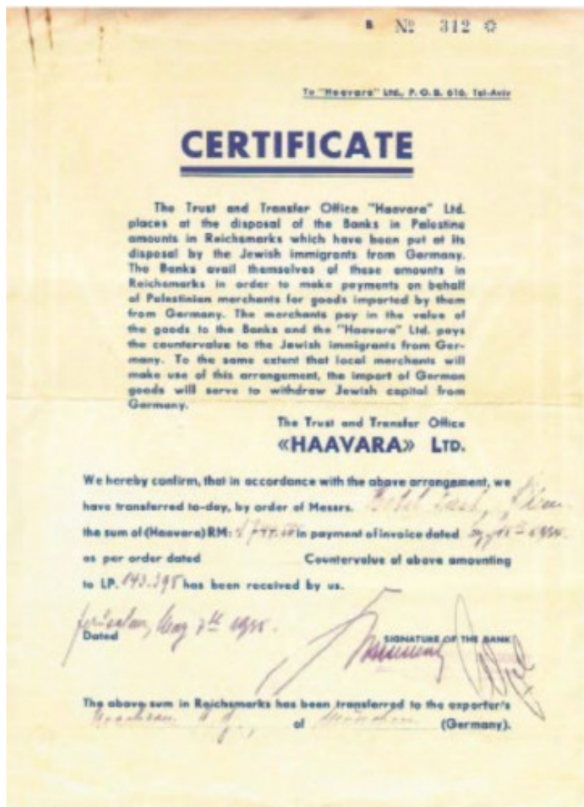
Certificato di trasferimento di capitali ebraici dalla Germania alla Palestina

L'accordo di Trasferimento è stato sottoscritto il 10 agosto 1933 dal Ministro dell'economia del Reich Kurt Schmitt e dal rappresentante del Movimento Sionista in Palestina Haim Arlosoroff che agiva per conto del Mapaï, il partito Sionista antenato del partito Laburista israeliano. A questa iniziativa politico-commerciale parteciparono personaggi divenuti in seguito molto noti come i futuri Primi Ministri David Ben-Gurion e Golda Meir (che collaborava da New York)(5).