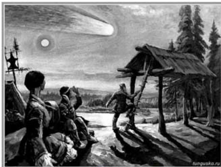
Федоров Н.И. "Тунгусский болид"