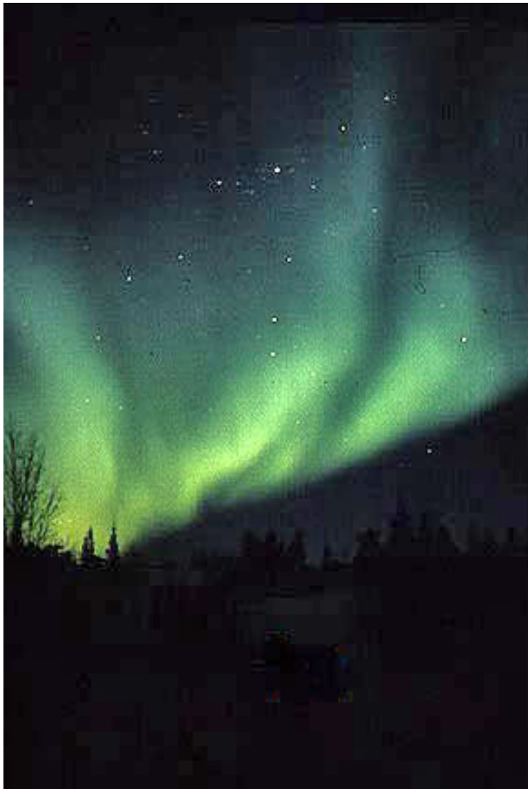
Ricostruzione artistica degli anomali bagliori osservati dopo un'esplosione.