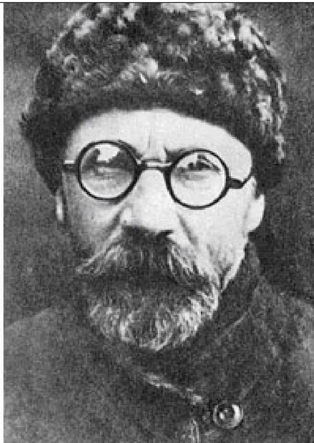
Leonid Kulik, primo ricercatore ad occuparsi dell'esplosione di Tunguska

Un aspetto degno di nota è che le leggende Yakut contengono davvero tanti riferimenti a esplosioni, turbine ardenti e al lancio di sfere fiammeggianti vomitate da "un orifizio che eruttava fumo e fuoco" con un "enorme coperchio d'acciaio", nelle cui profondità si trova un intero paese sotterraneo. Questo paese è abitato da un focoso furfante "il quale dissemina contagio e scaglia una sfera ardente" — il gigante Uot Usumu Tong Duurai (che si può tradurre come "il criminale straniero che ha perforato la terra e si nasconde nelle profondità, seminando tutt'attorno devastazione con un turbine ardente").