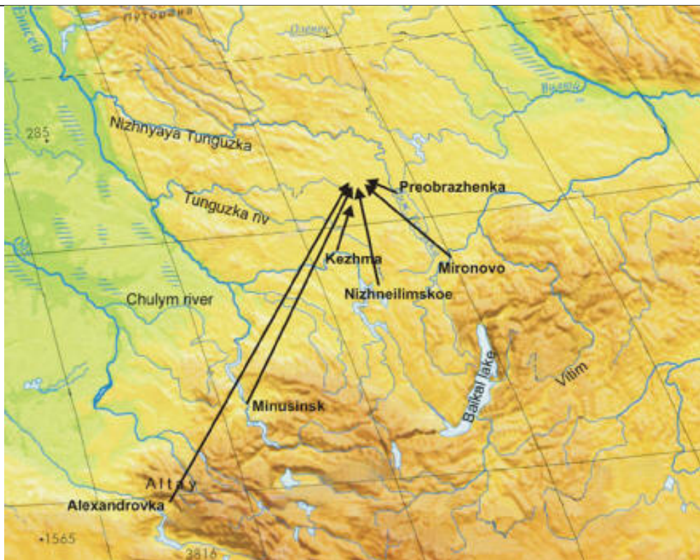
Mappa della regione indicante le traiettorie aeree dei diversi oggetti.

Negli archivi dell'ex Osservatorio Meteorologico e Magnetico di Irkutsk, i ricercatori sono riusciti a scovare delle annotazioni scritte da A. K. Kokorin , osservatore meteorologico presso la stazione sul fiume Kezhma, a circa 600 chilometri di distanza dal luogo dell'esplosione di Tunguska. Nel suo registro delle rilevazioni del giugno 1908, la sezione denominata "Note" contiene un'annotazione di eccezionale importanza, la quale indica che nella circostanza in questione vi era più di un corpo in volo.