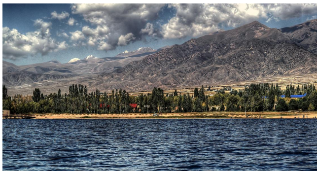
Issyk-Kul, il cui nome significa "lago caldo"

Boris Pavlovich Grabovsky, ingegnere sovietico, fu l'inventore del primo tubo di trasmissione televisiva completamente elettronico. Fu anche autore di Kosmicheskiy Biofaktor ("Il fattore biologico nel cosmo") e Prilozheniya i razvitiye cheloveka v kosmicheskoy sredy ("Applicazioni e sviluppo dell'uomo nell'ambiente spaziale").