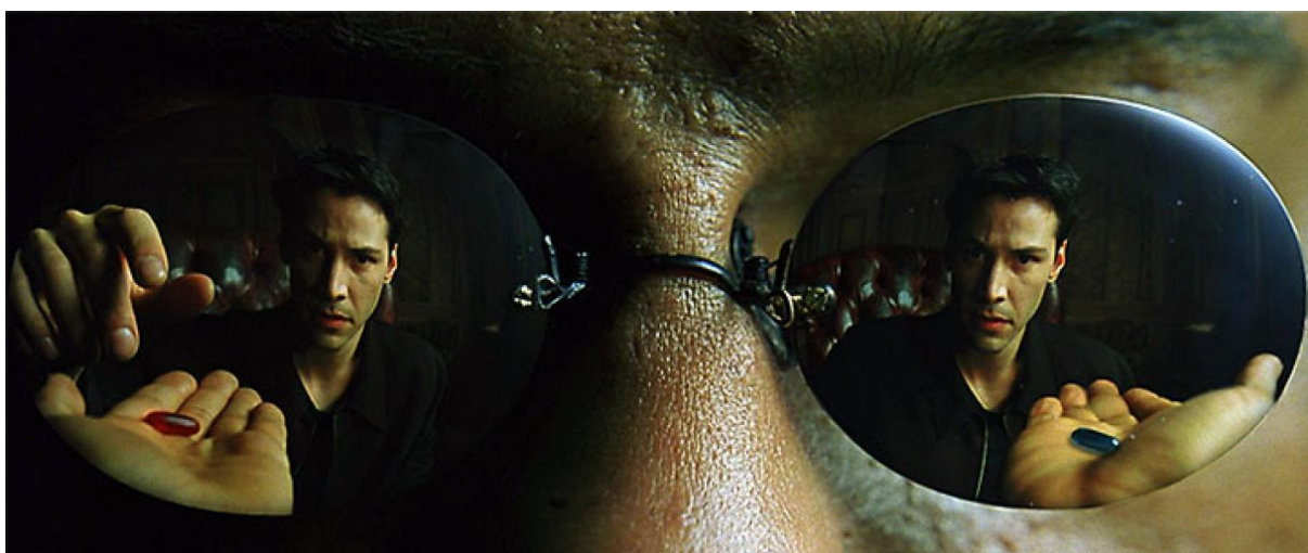
"Pillola blu o pillola rossa?" La nota domanda di Morpheus a Neo nel film Matrix (1999)

Il film Matrix è una moderna metafora gnostica della realtà umana ove la parola latina matrix, il cui