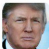
Donald J. Trump @realDonaldTrump

L'autismo è una delle maggiori crisi sanitarie del nostro tempo ed è il risultato evidente di un avvelenamento del cervello dei nostri bambini. Le scriteriate campagne vaccinali cui sono sottoposti i nostri figli entrano, anche loro, di diritto, sul banco degli imputati perché non c'è più alcun dubbio che i vaccini possono causare l'autismo: lo dichiarano industrie e organi di farmacovigilanza anche se cercano di occultare i dati.